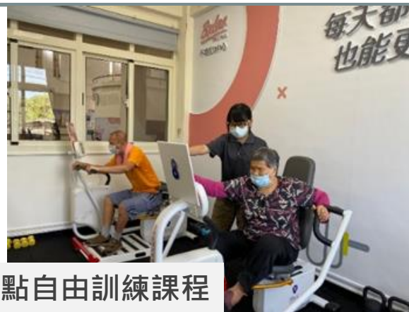
據點自由訓練課程