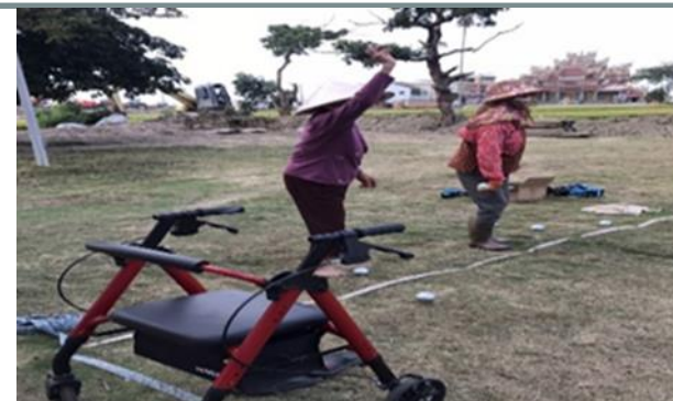
高齡長者阿嬤關節炎經治療參加比賽