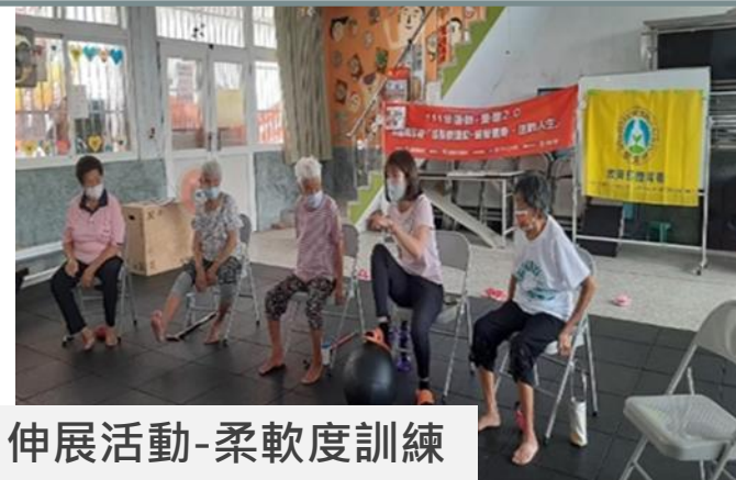
伸展活動-柔軟度訓練