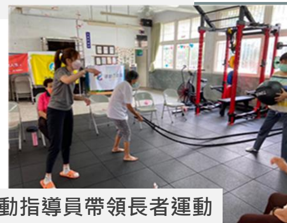
運動指導員帶領長者運動